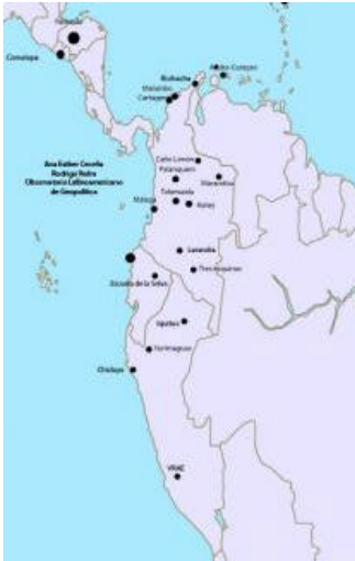
Recuadro #3 Mapa Bases de EEUU en Colombia