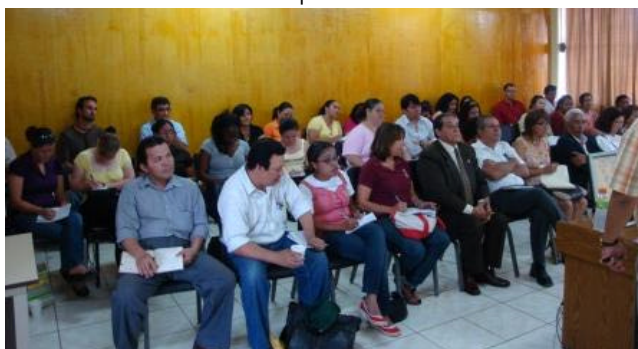
Recuadro #11 Participantes en el conversatorio

Un participante disiente en lo relacionado a la construcción colectiva de propuestas considerando que se necesita saber en qué terminará esto argumentando que las decisiones torales no están en nuestras manos. Desde su óptica, se está frente a una derrota o en una perspectiva de mejora de las formas de vida. Agrega que para muchos, se vislumbra una derrota producto de una negociación oscura entre Mel y los golpistas; aunque se preferiría una negociación abierta en la cual la gente en resistencia perciba la ganancia.