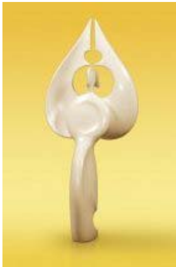
Yamunaqué, ceramista de Chulucanas, Perú